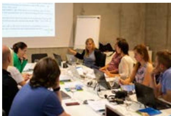
Zespół Me2Me podczas trzeciego spotkania – Kowno, Litwa.

Partnerzy projektu Me2Me koncentrują się na zapewnieniu specjalistom VET rozległych możliwości szkoleniowych, które będą uwzględniać bezpośrednie szkolenia, a także samodzielną naukę online. Obecnie powstaje, szereg rozdziałów nowego Programu Nauczania, które będą koncentrować się na istotnych aspektach pedagogicznych. Kluczowym celem szkolenia będzie umożliwienie nabycia umiejętności tworzenia i wykorzystywania interaktywnych materiałów mini-learningowych. Dzięki temu, szkoleniowcy będą mogli przekazywać swoją wiedzę w bardziej angażujący i efektywny sposób. Tworzone przez nich materiały będą natomiast posiadały wysoką jakość; będą łatwiej dostępne i bardziej interaktywne.